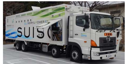
移動式水素ステーション